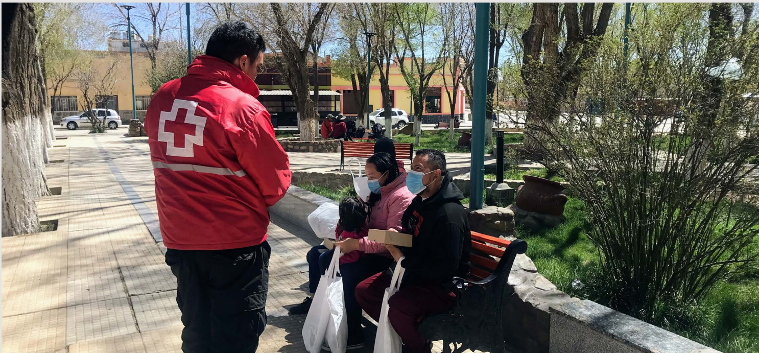
La Cruz Roja Argentina brinda asistencia humanitaria y protección a los migrantes necesitados de muchos países que llegan y viajan a través de sus fronteras.

La VOICES Network es un grupo británico de expertos por experiencia en desplazamientos forzados (principalmente refugiados y solicitantes de asilo), que han expresado la voluntad de compartir sus experiencias para cambiar mentalidades, políticas y prácticas. Con el apoyo de la Cruz Roja Británica, los embajadores de VOICES reciben formación, tutoría y apoyo psicosocial para hacer que se oigan sus voces. Hablan desde su experiencia personal y en nombre de la red y de otros refugiados y solicitantes de asilo colectivamente. Los embajadores de VOICES son independientes y no representan la opinión de la Cruz Roja Británica ni ninguna otra organización.