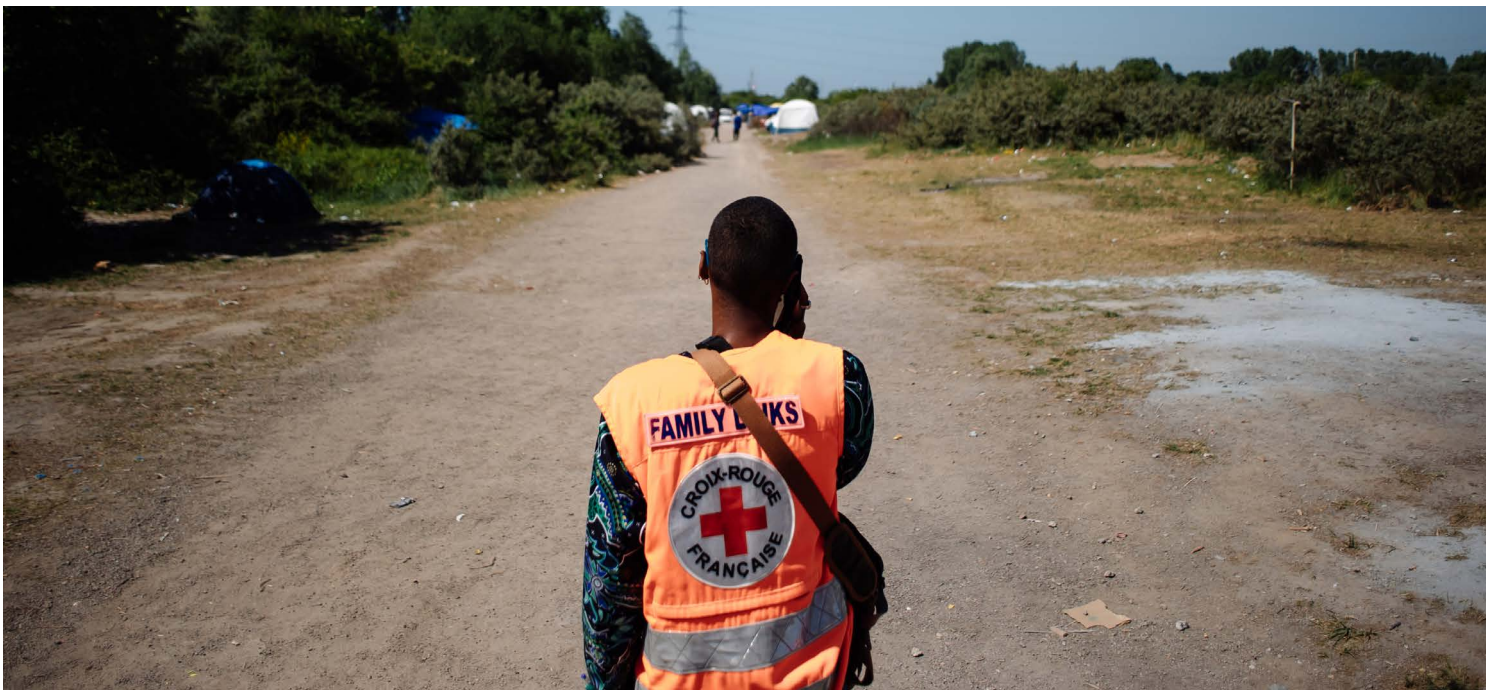
La Cruz Roja Francesa lleva a cabo el proyecto “Sistema de ayuda móvil para migrantes” en el norte de Francia.

11 de 18 informantes observaron que no contaban con herramientas ni recursos específicos para hacer operativa la participación significativa de las personas migrantes. En los casos en que sí había herramientas, los recursos más mencionados eran los relacionados con CEA. Curiosamente, algunos informantes clave informaron de que se organizaban sesiones sobre participación significativa como parte de la formación inicial para el nuevo personal y los voluntarios que trabajan en el ámbito de la migración. Solamente 5 de los 18 mencionaron que su SN había avanzado en los marcos para promover la participación significativa de las personas con experiencias vividas.