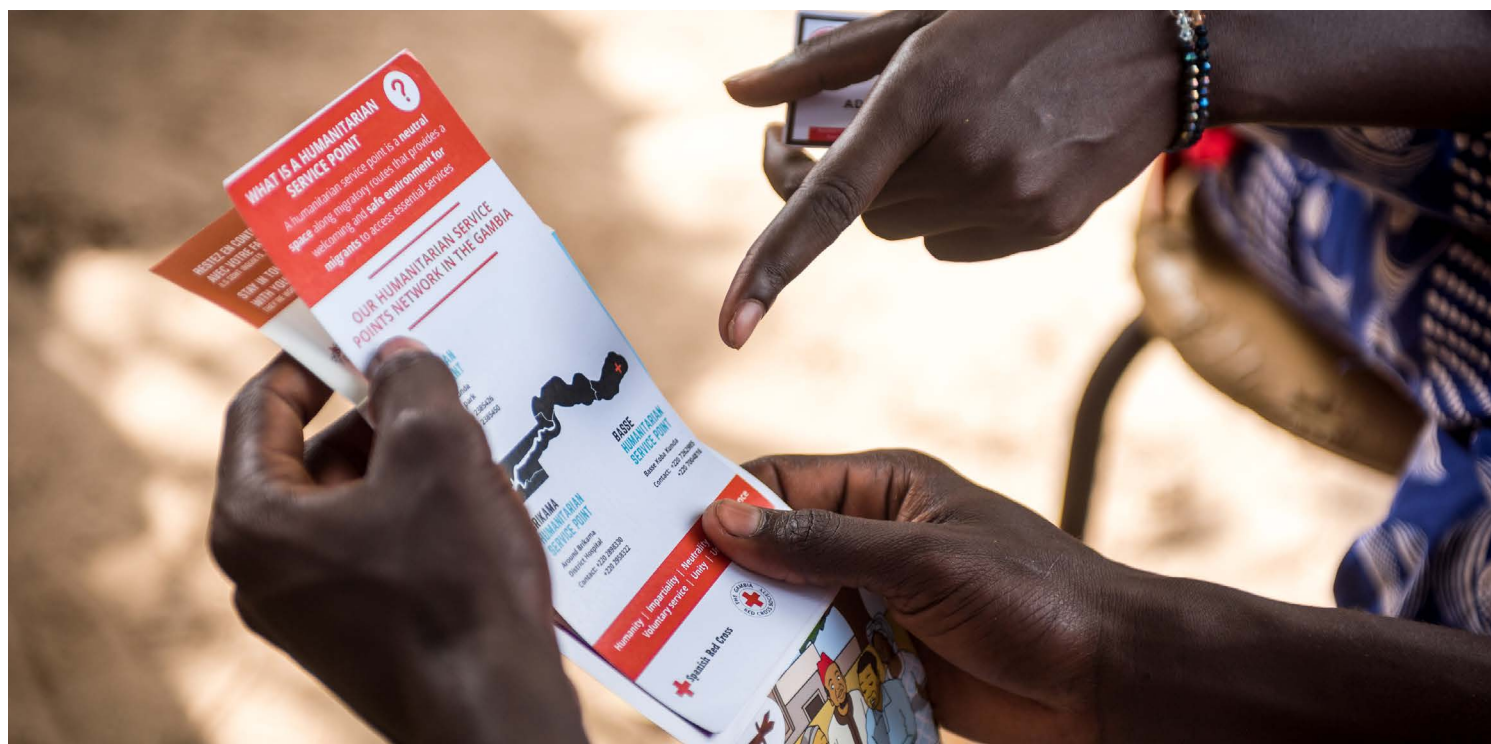
La Sociedad de la Cruz Roja de Gambia maneja Puntos de Servicios Humanitarios móviles y fijos para ofrecer protección y asistencia humanitaria a migrantes en tránsito por el país.

La selección de los informantes clave se basó en sugerencias de puntos focales regionales y mundiales de la FICR y el CICR y a través de anteriores proyectos de investigación del Laboratorio.