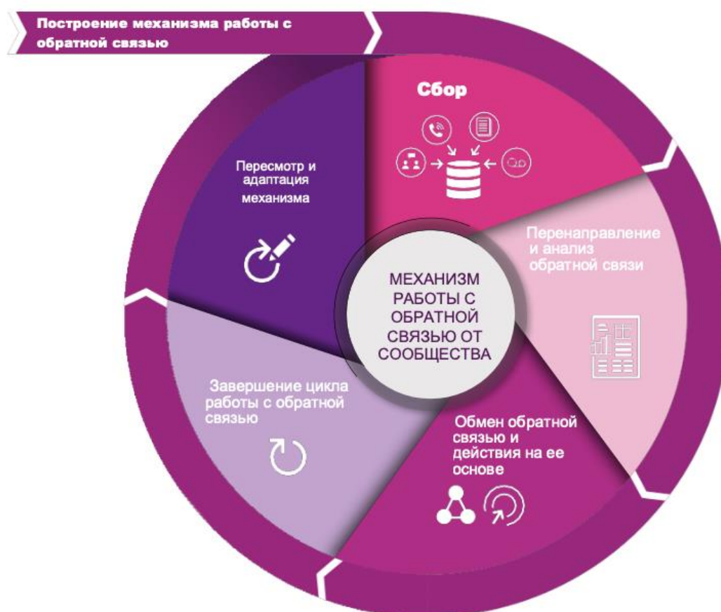
Рисунок: этапы механизма работы с обратной связью

В основе инструментария лежат 6 этапов цикла обратной связи: